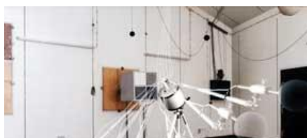
ĂȘURĂTORI ASUPRA TENUATOARELOR DE ZGOMOT ROIECTARE ACUSTICĂ