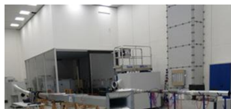
TEST FACILITIES TEHNOLOGIA DE CONTROL