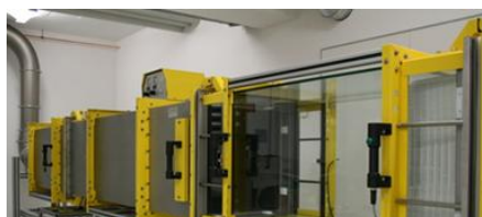
ENTRU CELE MAI EXIGENTE